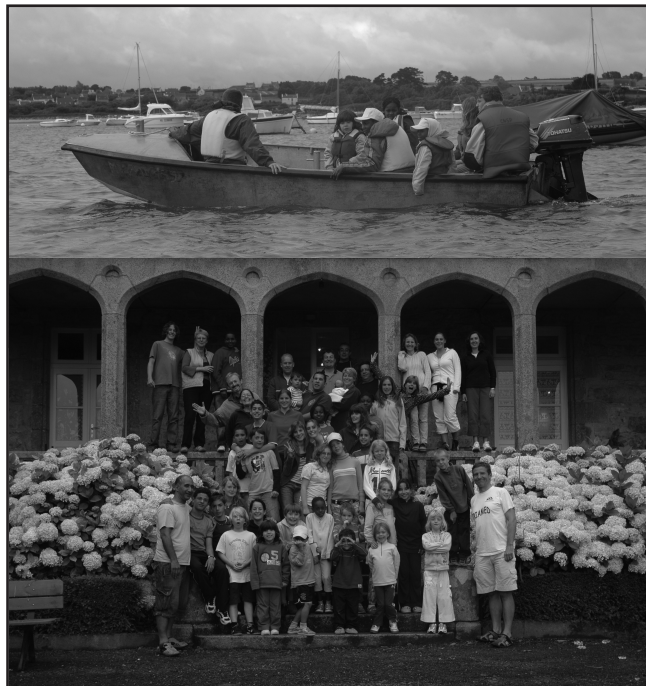
Les vacances d'été à Kersaliou...